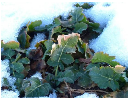
Attention aux gelées tardives