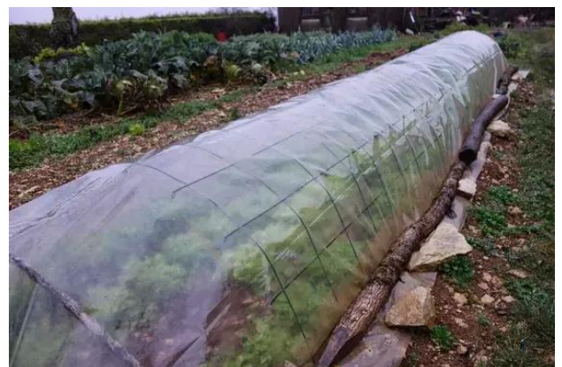
Un tunnel pour protéger les légumes du gel